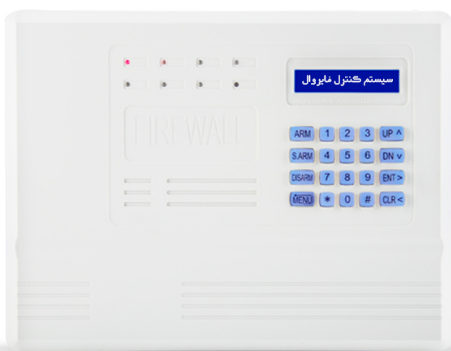
دزگری ناوهندی F10

لهگهڵ زیادبوونی تاوان له پیکهاته جیاوازهکاندا، پاراستنی مولک و مالی خهک بووته پپویستییهک، ٹامپره دزگرهکان، جگهلهوهی دلنیاپی دهدهنه خاوهن مولکهکان که مولکهکانیان سهلامهته، بهلکو ههستکردن به ئاسایش و ئارامی به خهک دهبهخشیت. دانانی سیستمی ئەلهرم رپگه به خاوهن مولکهکان دهوات له ئەگهری رووداویدا کاردانهوهی خیرایان ههبییت و رپوشوینی پپویست بگرنههر بۆ پاراستنی خویان و مولکهکانیان ئەم سیستمه بهزۆری به سیستمی ئاگادارکردنهوهی ئاگر و دزهوه پهیوهستن بۆ ئەوهی ههر جوړه رووداویک به شیوهیهکی ئۆتۆماتیکی رابگهیهنریت.