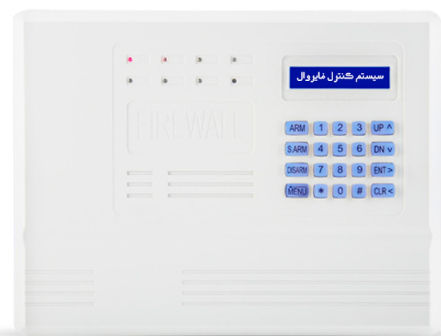
دزگری ناوهندی F9