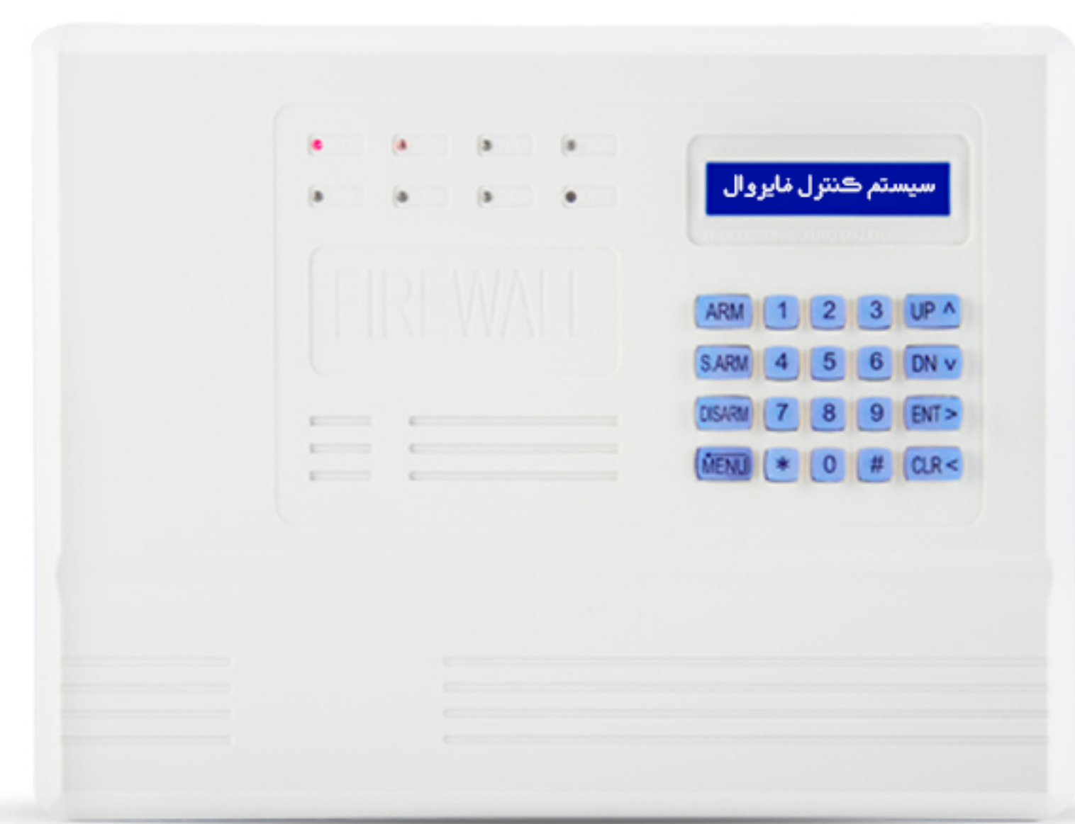
دزگری ناوهندی F9